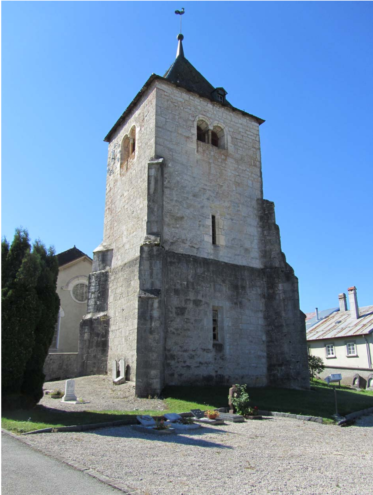
La tour vue du cimetière. Elle est tout bonnement superbe et prête à défier encore quelques autres siècles !