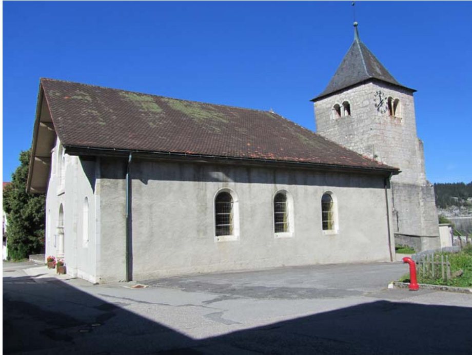
L'église, vue de sa façade nord-est. A droite vous ouvrez le portail qui vous emmènera au cimetière.