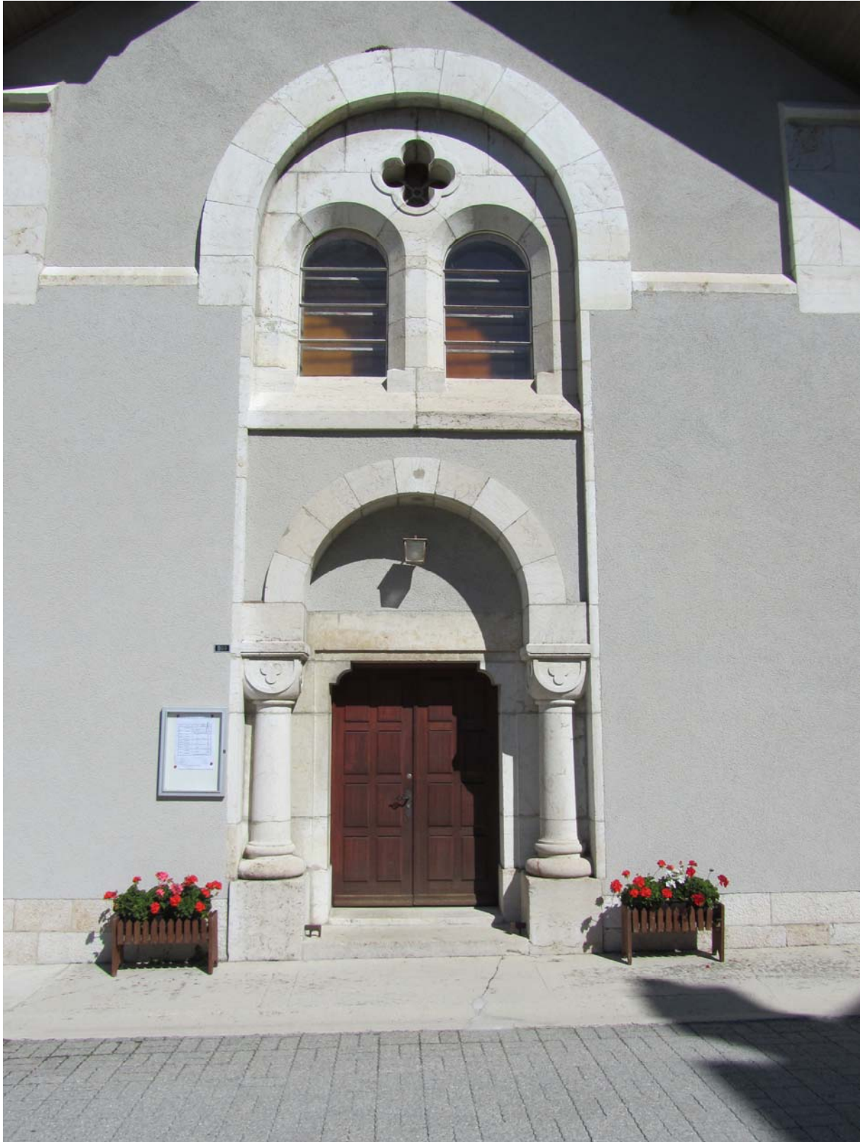
Entrée du temple de l'Abbaye avec quelques éléments romans qui pourraient peut-être provenir du temple précédent.