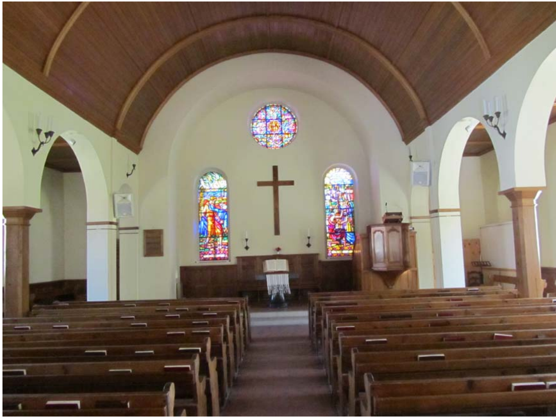
L'intérieur est très chaleureux, avec son beau plafond de bois en berceau. Détail des vitraux à la page suivante.